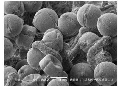
Grains de pollen de patate sauvage formant des tubes polliniques après germination sur le pistil.

Geitmann. À l'aide de différents microscopes ultraperformants, elle cherche à comprendre comment une cellule peut accomplir une telle prouesse. « Contrairement aux cellules humaines, les cellules végétales possèdent une paroi extérieure d'une certaine rigidité, dit-elle. Grâce à cette qualité, elles peuvent être sou-