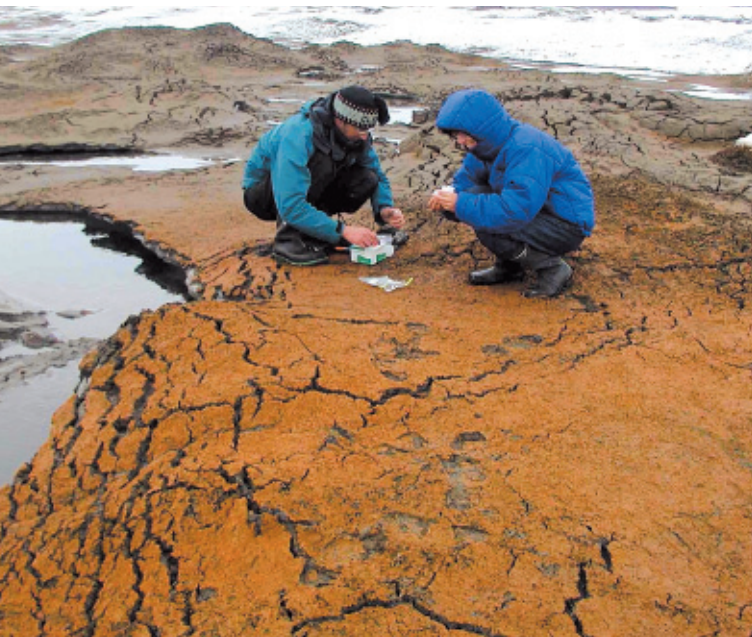
Des chercheurs étudient un luxuriant tapis microbien de la plate-forme de glace Markham, un des derniers écosystèmes de glace sur la rive nord de l'île d'Ellesmere.

La formation extrêmement rapide de ce tube fascine Anja