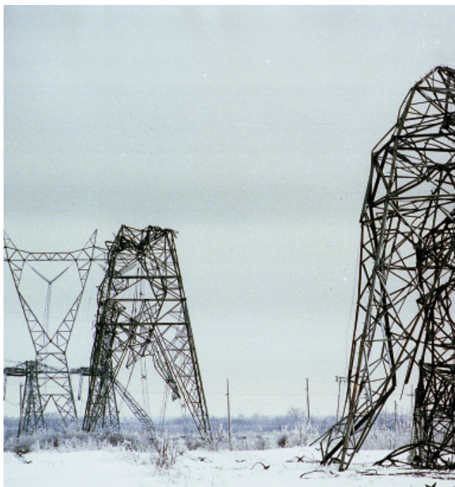
Lignes de transport d'Hydro-Québec détruites par la tempête de verglas en 1998.

« Le réseau québécois a été protégé ce jour-là parce qu'il est construit de façon que les perturbations des autres réseaux l'affectent peu, explique Francisco Galiana , professeur au Département de génie électrique et informatique de l'Uni-