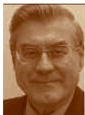
Prix Marie-Victorin Sciences de la nature et du génie

Les Prix du Québec représentent la plus haute distinction décernée par le gouvernement du Québec